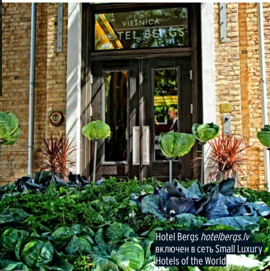
Hotel Bergs hotelbergs.lv включен в сеть Small Luxury Hotels of the World